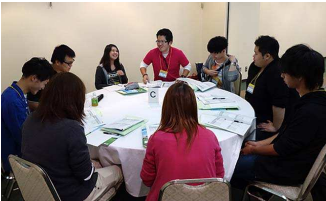
【最初のグループ会議。中央が本人】

私は、9月13日から15日まで帯広で開催されたライラセミナーに参加してきました。