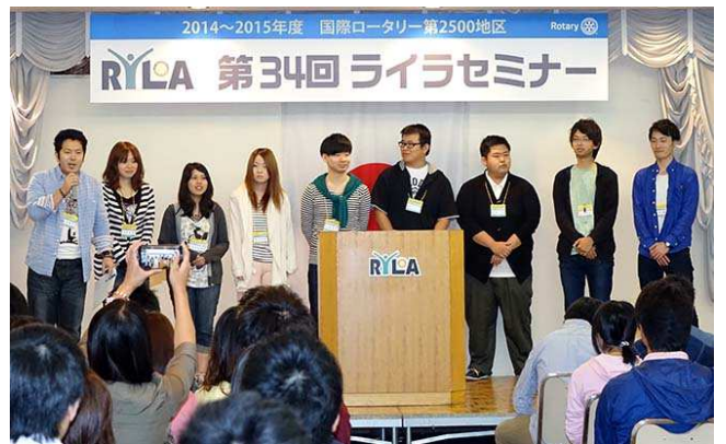
【グループ発表をする本人(左端)】

その後、隣接するアイスクリーム屋のレシピを基にして全員でアイスを作りましたが、テーブル毎で味が異なっていたので、理由を担当者に伺ったところ、混ぜる時に入る空気の色によって味が変わる、ということを知りました。