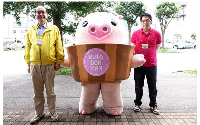
【セミナー会場前でお出迎えのブタドンマンと】

実際に牛舎に行き、生まれたての子牛に触れたり、搾乳体験をさせていただいたりしました。触れることにより、牛たちの温もりや生命の尊さを感じ、私達がいつも口にする乳製品のありがたさを身を持って体感してきました。